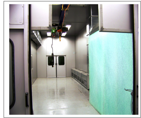
Blick in den Trocknungsbereich

Kontakt: j.schubert@heimer-lackieranlagen.de